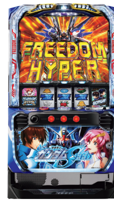
Lパチスロ 機動戦士ガンダムSEED