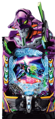
e 新世紀エヴァンゲリオン ～はじまりの記憶～