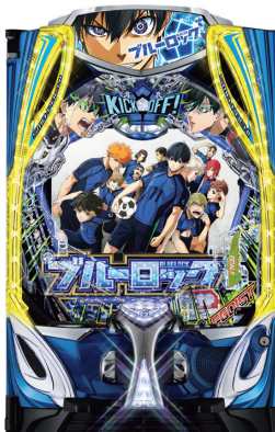
eフィーバーブルーロック