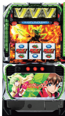
Lパチスロ 革命機ヴァルヴレイヴ2